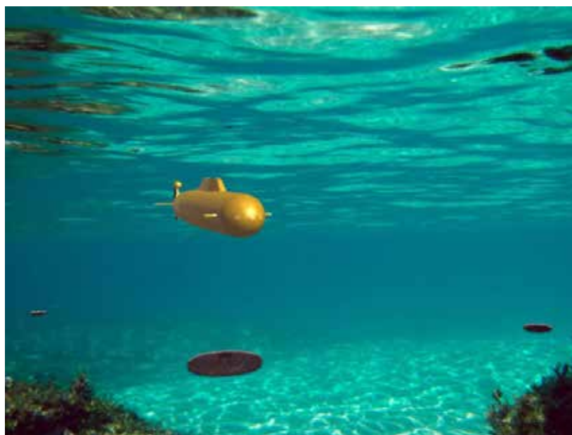
Рис. 3. Сбор данных с автономной сети расположенных на дне сенсоров

В [31] описан способ получения данных с OBS с помощью REMUS AUV с дальностью действия около 40 км. AUV может выполнить обход всей сети OBS за одну миссию для извлечения данных, полученных в течение заданного времени. Разработана технология извлечения данных из автономного OBS с использованием высокоскоростного оптического модема, способного поддерживать постоянную скорость передачи 10 Мбит/с, что более чем в 10 000 раз превышает скорость подводной телеметрии с помощью акустических модемов. Одновременно измеряется смещение времени между часами OBS и истинным временем