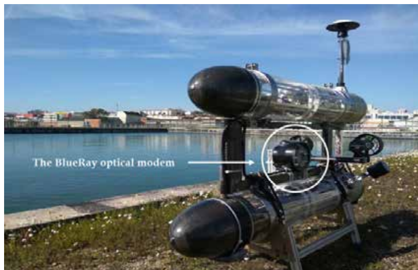
Рис. 2. АНПА Medusa с оптомодемом Blue Ray, разработан в ISR/IST (Португалия)

информацией, а также данными управления и навигации, чтобы группа могла принимать требуемые пространственные конфигурации и осмысленно реагировать на внешние события. Учитывая предполагаемые сценарии миссий для АНПА Medusa разработаны коммуникационные решения, которые дополняют акустику. В статье [18] сообщается об испытаниях оптического модема для двусторонней связи между парой АНПА Medusa.