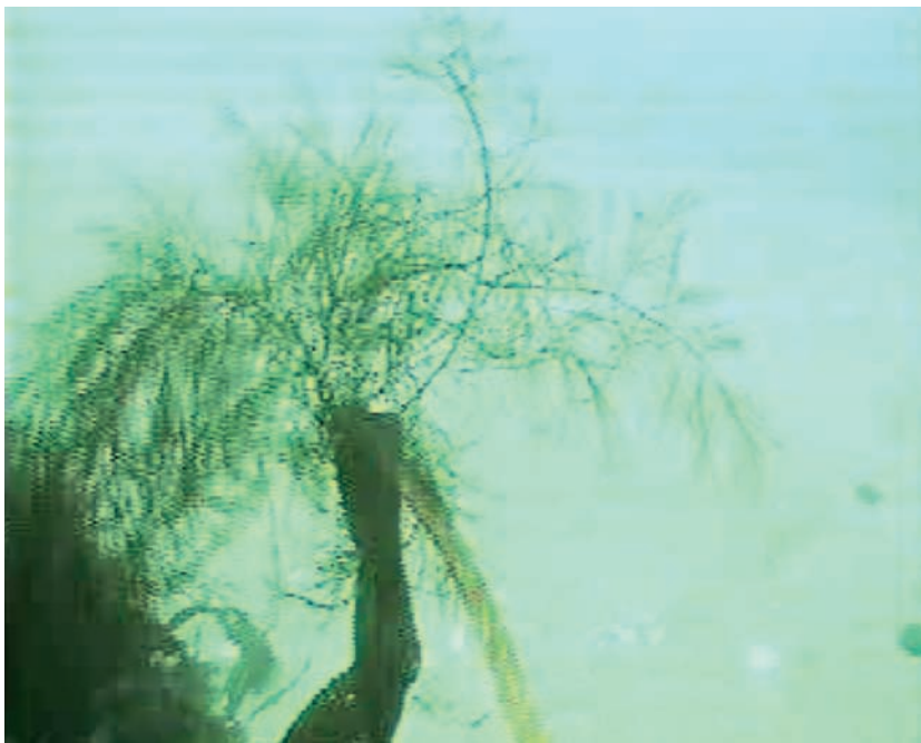
Рис. 4 Изображение водорослей, вычлененное из видеоряда цифровой видеокамеры и вполне достаточное для идентификации, несмотря на малое разрешение снимка