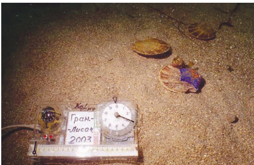
Рис. 1 Фрагменты съемки подводного ландшафта (бентемы)

Оно будет называться так, как мы это сами назовем, поскольку этого еще никто никогда не называл. Для передачи информации требуются слова. Как и везде, в специальной области нужен специальный язык. Для подводного мира и